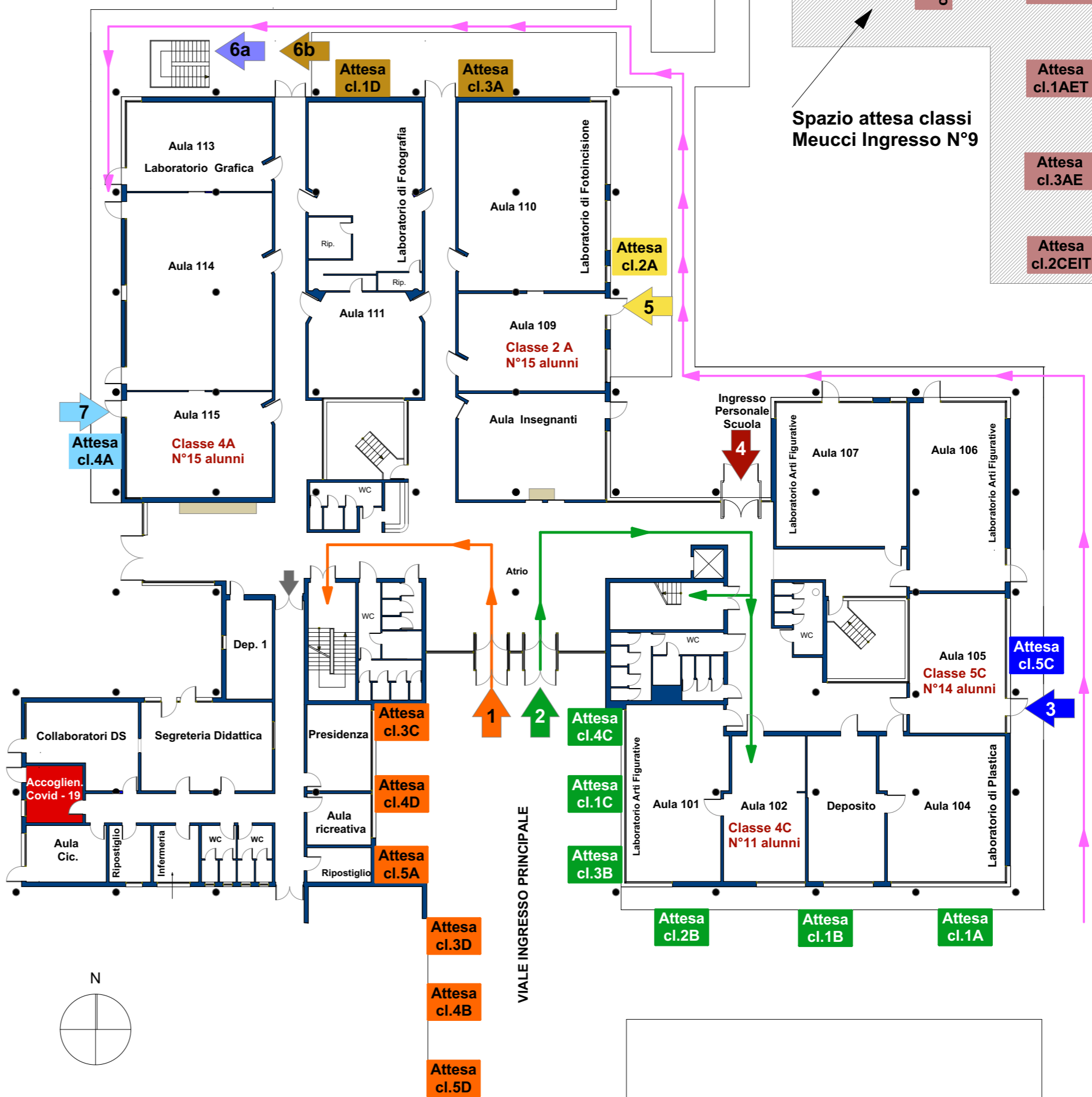
Tavola degli Ingressi e delle Uscite